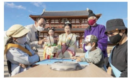
かりうちの様子