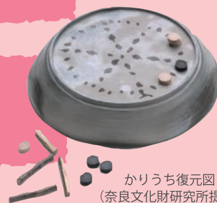
かりうち復元図

●日時／2025年3月20日(木・祝) 10:00～15:00(入場開始9:30～)